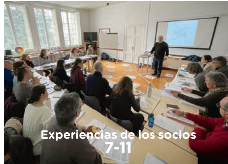
Experiencias de los socios 7-11