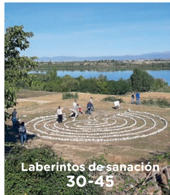
Laberintos de sanación 30-45